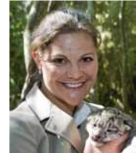
H.K.H. Kronprinsessan Victoria är Nordens Arks högsta beskyddare.

Nordens Arks Vänner nås på telefon: 0523-795 95, eller e-post: nordensarksvanner@nordensark.se .