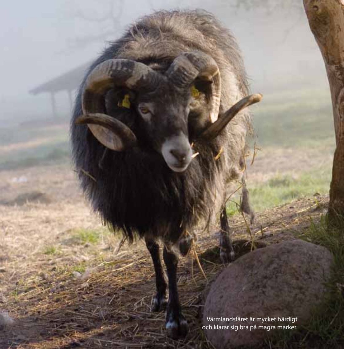
Värmlandsfåret är mycket hårdigt och klarar sig bra på magra marker.